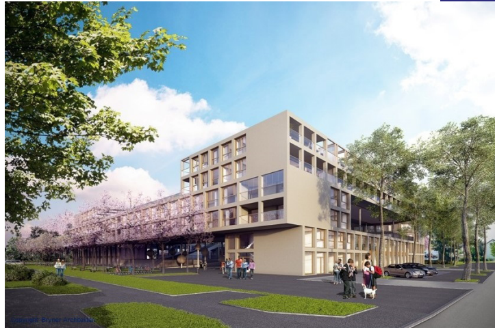
Mehrgenerationenzentrum Lichtfeld Uster