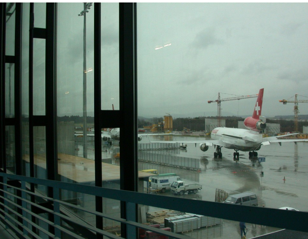
Fassade Dock Midfield

Wir sind bestrebt, nicht nur Ingenieuraufgaben zu lösen, sondern mit unserer Arbeit für unsere Kunden Mehrwerte zu schaffen. Für zahlreiche Kunden ist die Dr. J. Grob & Partner AG die erste Adresse für robuste, nachhaltige und wirtschaftliche Lösungen.